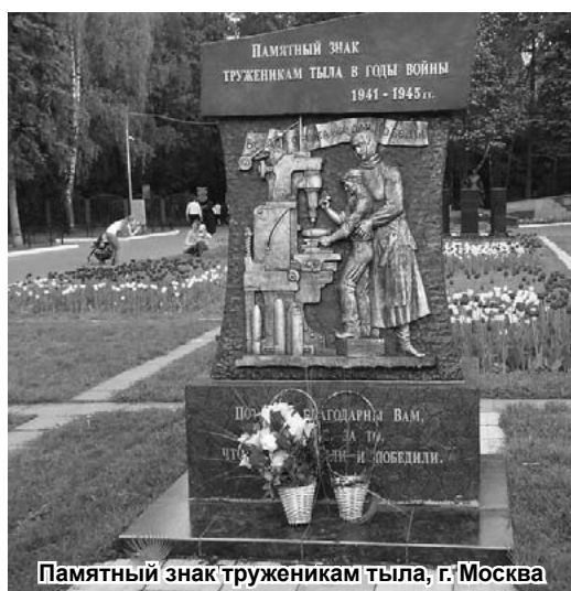
Памятный знак труженикам тыла, г. Москва

Случается, что после пятничных проповедей, праздничных вагазов, в частных беседах с прихожанами – ветеранами войны и трудового тыла выявляются новые факты участия мусульман в сражениях, в сборах материальных средств, теплой одежды и т.д.; оказании помощи партизанам; отыскиваются в семейных альбомах фотографии предвоенных и военных лет, которые до сих пор не афишировались – все вновь собранные материалы пересылаются в исторические музеи, библиотеки, школьные музеи Боевой Славы, «Книги Памяти», а также в архив данных для многоотомного труда Великой Отечественной войне 1941-1945 годов. Особенно такого рода