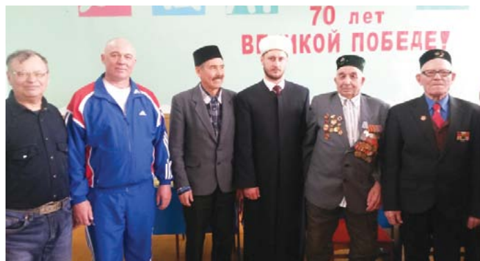
Чествование ветеранов в с. Верхняяркево Илишевского района РБ

Уважаемые читатели! Относитесь с почтением к газете, не используйте ее в недостойных целях