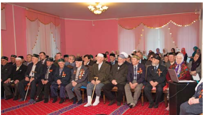
Чествование ветеранов в мечети «Ускудар» (г. Саранск)